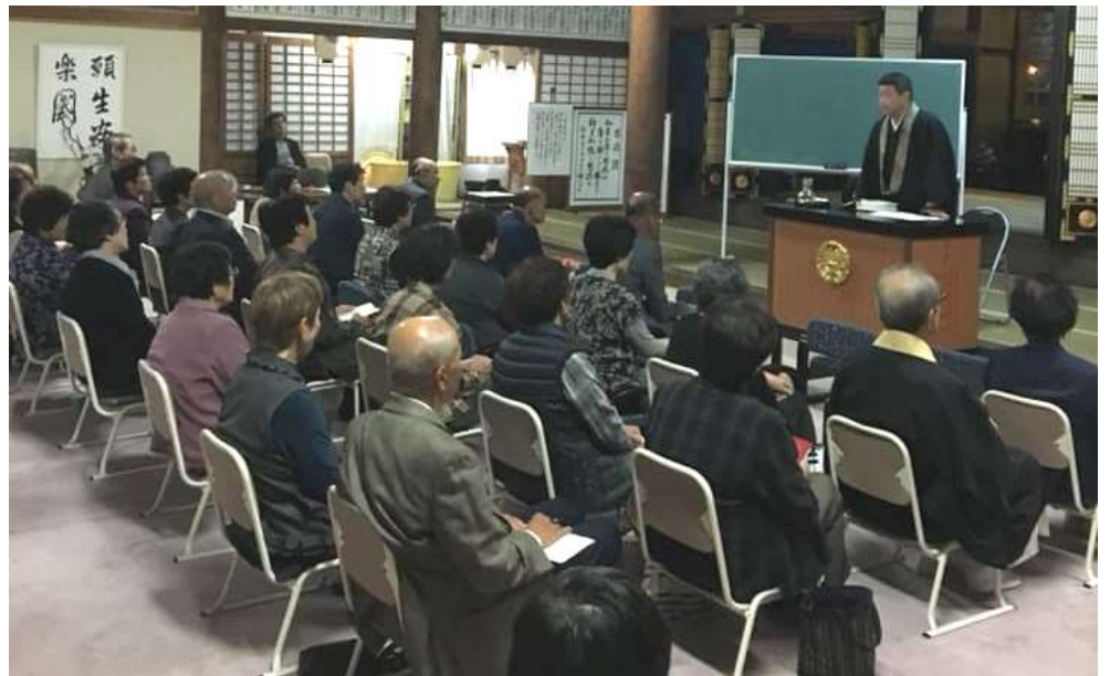
玉永寺報恩講の様子です